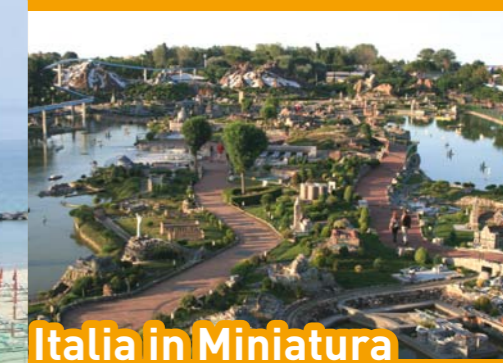
Italia in Miniatura